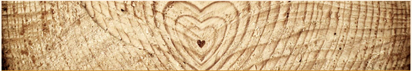
Ein kleiner Vorgeschmack: Das Bild auf der Eingangsseite